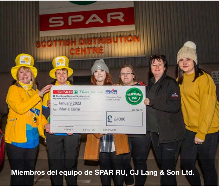
Miembros del equipo de SPAR RU, CJ Lang & Son Ltd.