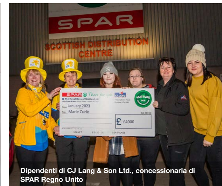
Dipendenti di CJ Lang & Son Ltd., concessionaria di SPAR Regno Unito