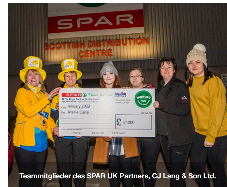
Teammitglieder des SPAR UK Partners, CJ Lang & Son Ltd.